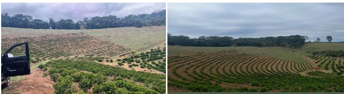
Figura 1: Fotos da lavoura localizada no município de Santa Margarida onde foi implantado o experimento.

A espécie utilizada foi ( Coffea Arábica L. ) popularmente conhecida como café Arábica, a variedade escolhida foi a Catucaí e a cultivar foi o Catucaí 785-15 Amarelo. A lavoura plantada na primeira semana de novembro de 2021, tendo no momento de avaliação, o espaçamento de 2,80 x 0,80 metros totalizando 4.464 plantas por hectare. (Figura 1).