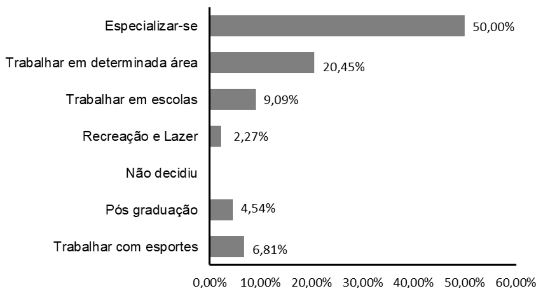
Figura 2: Planos de futuro para carreira de acadêmicos de Graduação em Educação Física de uma faculdade da Zona da Mata Mineira, expressos em frequência relativa. Matipó-MG. 2020.

A figura 2 tratou sobre a questão número 10, que pergunta quais são os planos de futuro para a carreira dos pesquisados.