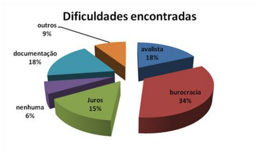
Figura 2: Dificuldades encontradas pelos agricultores familiares de Durandé (MG) para adesão ao Programa Nacional de Fortalecimento da Agricultura Familiar (PRONAF).

De todos os entrevistados que utilizaram recursos do PRONAF, 27 disseram que o mesmo trouxe melhorias para a propriedade e para a vida como um todo; os demais alegaram não ter havido nenhuma melhoria. Entretanto, a grande maioria disse que utilizaria novamente os recursos do programa, inclusive os que relataram não ter havido melhorias na vida deles, justificando dessa forma a crescente evolução dos contratos do PRONAF, conforme dados do Ministério do Desenvolvimento Agrário (MDA, 2015) (Figura 3).