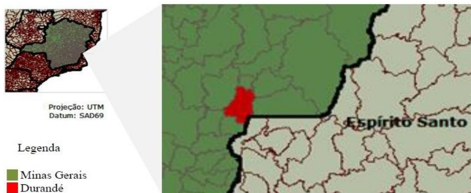
Figura 1: Mapa localizando a cidade de Durandé (MG).