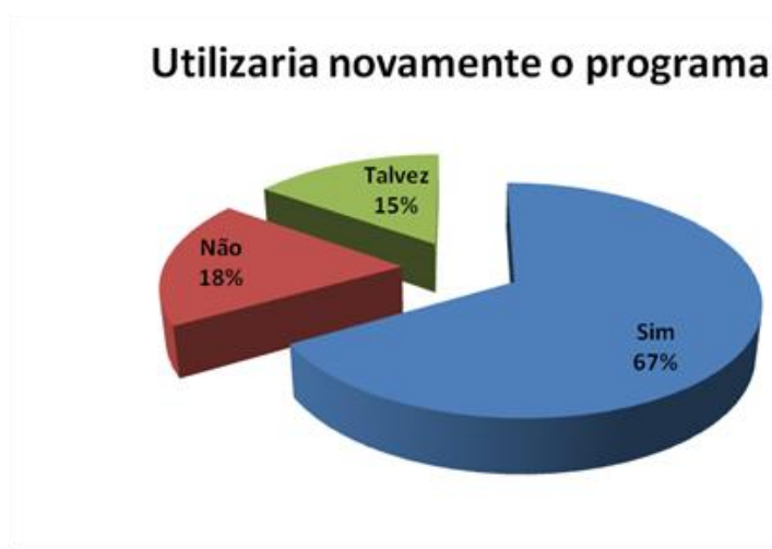
Figura 4: Porcentagem de entrevistados que utilizaria novamente recursos provenientes do Programa Nacional de Fortalecimento da Agricultura Familiar (PRONAF).

Dos entrevistados, a maioria afirmou que voltaria a utilizar o programa, isso devido às baixas taxas de juros e ao longo período para o pagamento (Figura 4).