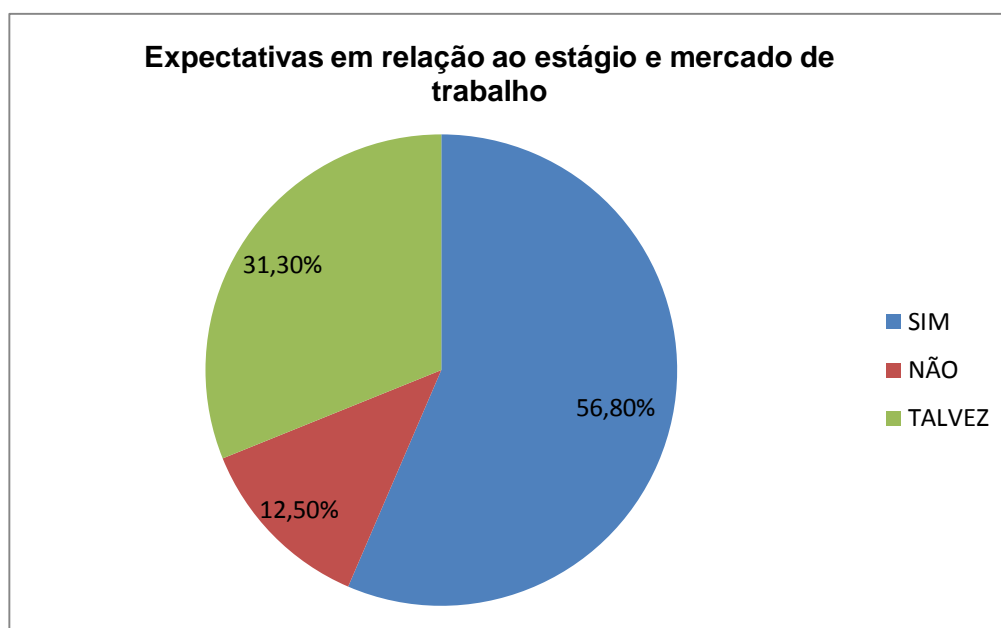
Gráfico 2- Estágio X mercado de trabalho

A pesquisa investigou também sobre as expectativas atendidas pela experiência de estágio. Ao serem questionados sobre se “o estágio atende as suas expectativas em relação à aquisição de novos conhecimentos e experiência prática importante para sua futura atuação profissional”, a resposta dos estagiários configura o gráfico seguinte: