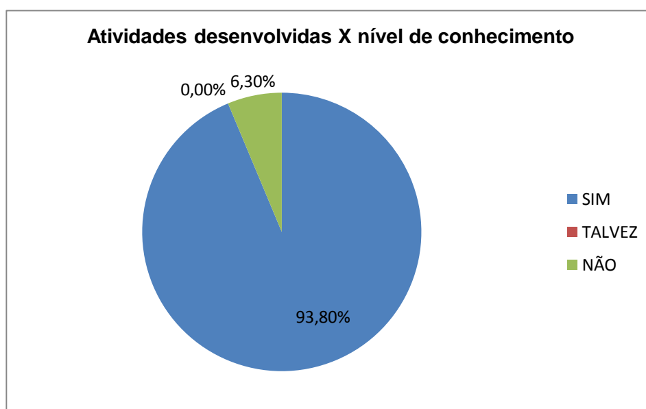
Gráfico 1- Atividades desenvolvidas X nível de conhecimento

O questionário aplicado aos estudantes serviu de base para entender como se sentiam em relação ao estágio supervisionado básico em Psicologia Organizacional. Uma das questões levantadas no questionário foi a respeito ao nível de conhecimento exigido nas atividades de estágio, conforme demonstra o gráfico 01.